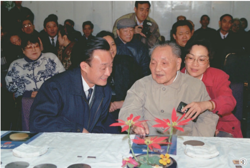
图①：1992年2月10日，邓小平同志在上海贝岭微电子制造有限公司参观时与吴邦国同志交谈。