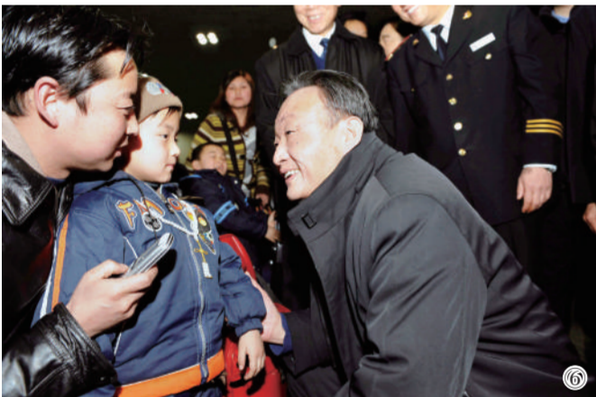
图⑥：2008年2月3日，吴邦国同志在北京西站候车室与旅客交谈。