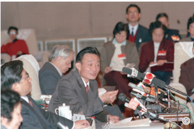
图⑤：1994年3月，时任上海市委书记的吴邦国同志在全国两会上海代表团团会上。

吴邦国同志高度重视人大监督工作，明确提出“围绕中心、突出重点、讲求实效”的监督工作思路，完善监督工作方式方法，有力推动了党中央重大决策部署贯彻落实。任期内，全国人大常委会共听取和审议“一府两院”报告126个，组织执法检查46次，对环保、司法等多个领域开展跟踪监督。（下转第4版）