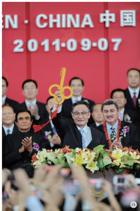
图⑨：二〇一一年九月七日，吴邦国同志在福建厦门出席第十五届中国国际投资贸易洽谈会开幕式。