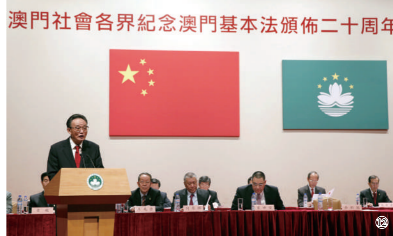
图⑫：2013年2月21日，吴邦国同志在澳门文化中心出席澳门社会各界纪念澳门基本法颁布20周年启动大会并发表讲话。