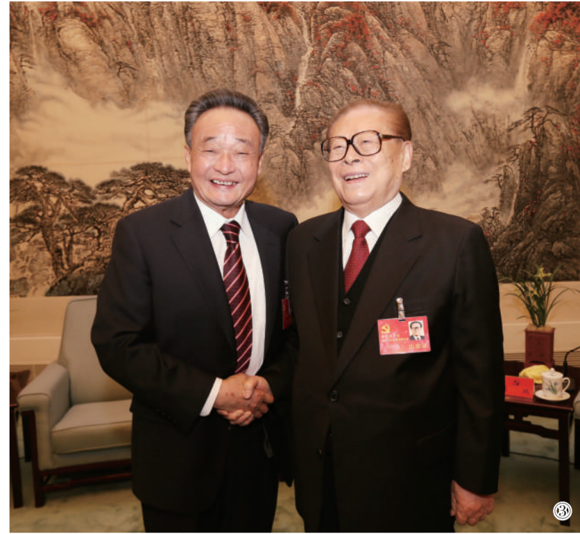
图③：2012年11月14日，中国共产党第十八次全国代表大会在北京闭幕。这是闭幕会前，江泽民同志与吴邦国同志在一起。