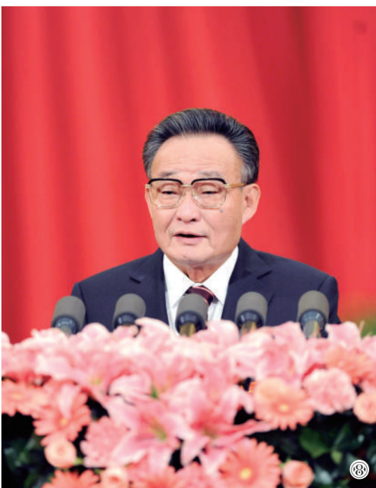
图⑧：二〇一一年三月十日，十一届全国人大四次会议在北京人民大会堂举行第二次全体会议。吴邦国同志作全国人大常委会工作报告。