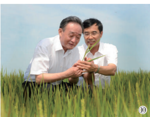
图⑩：2012年7月19日，吴邦国同志在黑龙江农垦建三江管理局二道河农场万亩大地号察看水稻长势。