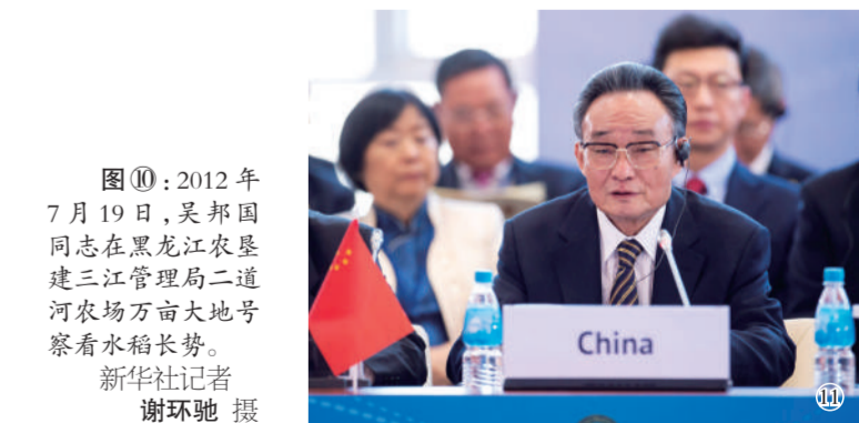
图⑪：2013年1月28日，吴邦国同志在俄罗斯符拉迪沃斯托克出席亚太会议论坛第21届年会，并作题为《坚持和平发展 促进合作共赢》的主旨发言。