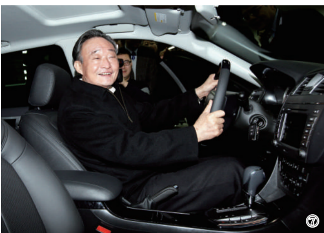
图⑦：2010年1月30日，吴邦国同志在上海汽车集团股份有限公司技术中心察看新能源样车。