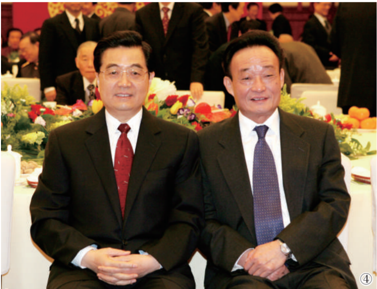
图④：二〇〇五年一月一日，全国政协在北京举行新年茶话会。这是胡锦涛同志与吴邦国同志在一起。新华社记者 樊如钧 摄