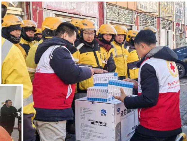
这几天，气温骤降，但是户外工作者依然坚守在自己的岗位上，服务广大市民。11月28日，市委社会工作部联合市红十字会开展为新就业群体发放爱心药品活动，为奔波在城市街头的户外工作者送去冬日的温暖。