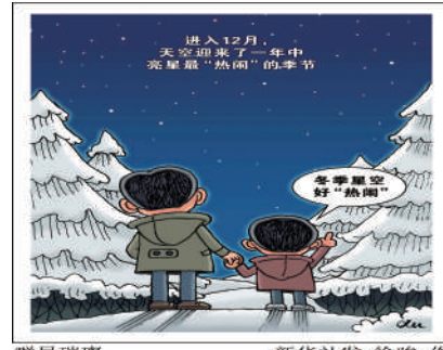
冬季星空“热闹”的季节 新华社发 徐峻 作

冬季众多的亮星还会组成该季的代表性图案。由天狼星、小犬座南河三及猎户座参宿四组成的“冬季大三角”是代表图案之一，位于天球的赤道附近，几乎整个北半球都可见到。“冬季大钻石”则是冬季星空另一代表性图案，它是由天狼星、南河三、猎户座的参宿七、金牛座的毕宿五、御夫