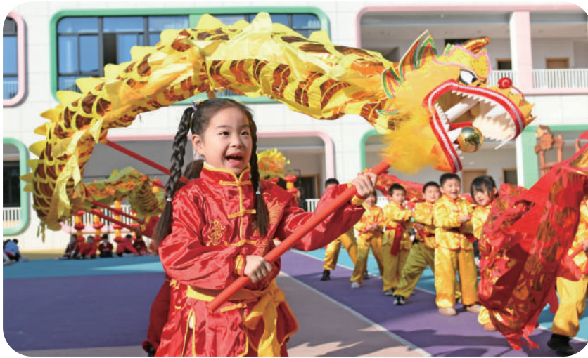
浙江省台州市仙居县迎晖幼儿园的小朋友在表演舞龙，喜迎龙年新春（2024年1月18日报）。12月4日，正在巴拉圭亚松森召开的联合国教科文组织保护非物质文化遗产政府间委员会第19届常会通过评审，决定将“春节——中国人庆祝传统新年的社会实践”列入人类非物质文化遗产代表作名录。新华社发 王华斌 摄

信自强形象，加强文明交流互鉴、讲好中华优秀传统文化故事的重要渠道。党的十八大以来，我们深入贯彻落实习近平文化思想和习近平总书记关于文化遗产保护传承重要指示批示精神，深入挖掘春节所蕴含的中华优秀传统文化价值，广泛开展春节传承实践与传播展示活动。无论是城市的街市社区，还是乡村的庙会圩集，各地非遗活动丰富多彩，深受老百姓喜爱。各类非遗项目在融入春节等传统节日中，不断满足人民日益增长的美好生活需要。