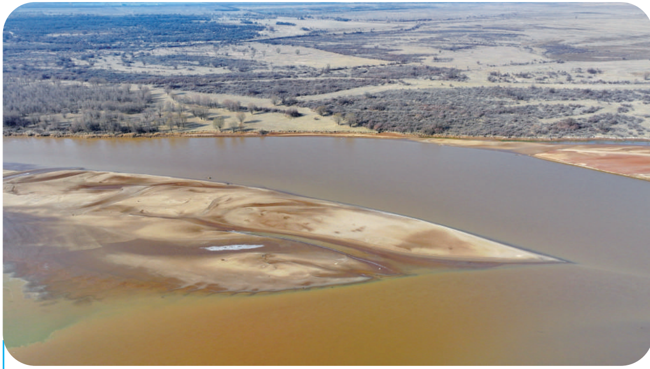
这是12月4日在宁夏石嘴山市拍摄的黄河景色（无人机照片）。入冬以来，黄河宁夏段滩涂呈现别样的景致。