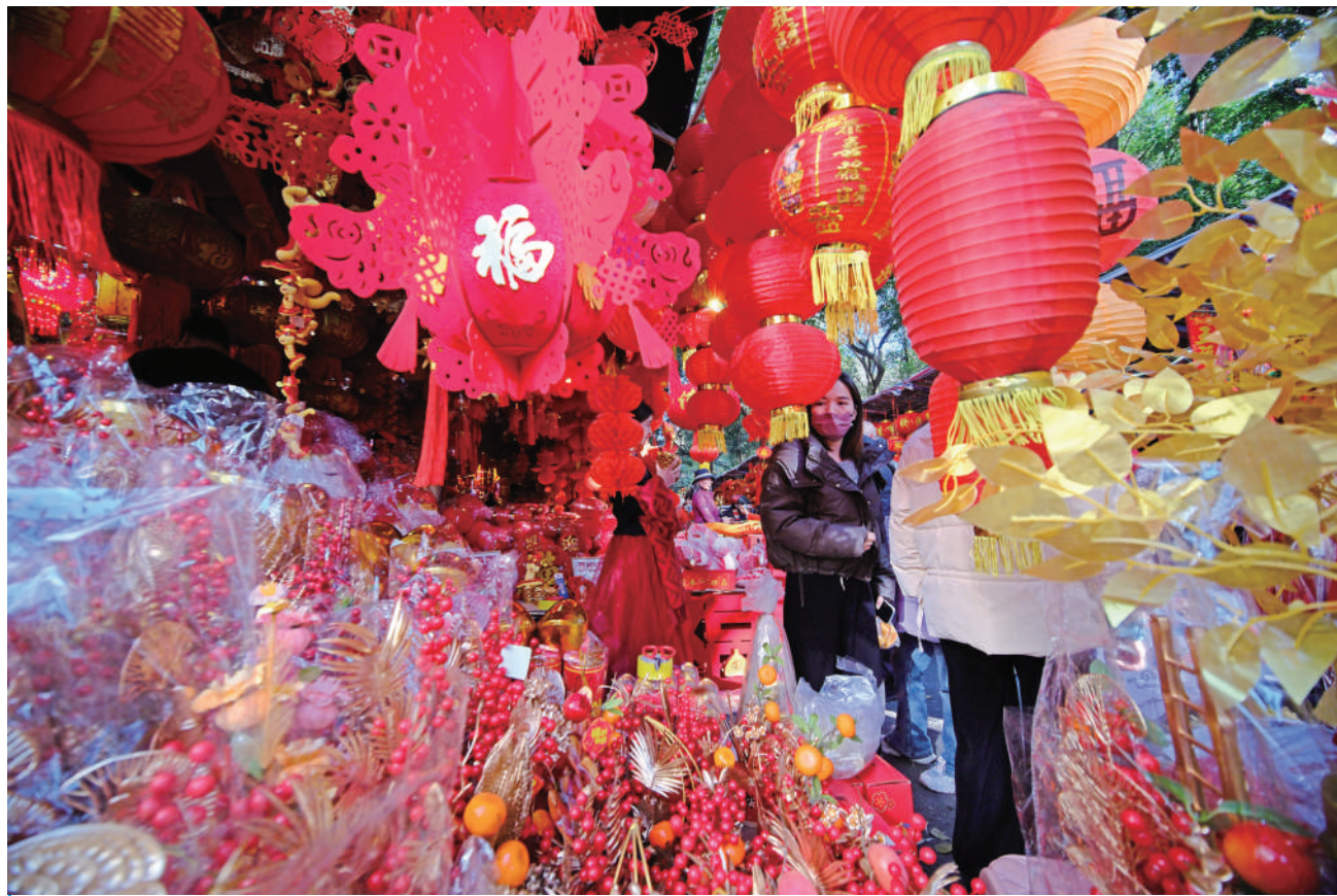
1月12日，市民在南宁市交易场附近的摊位上选购新春饰品。随着春节的临近，广西南宁市交易场附近的新春饰品摊位生意日益红火，众多市民前来采购春联、窗花等新春饰品。