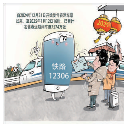
有序售票保障春运 新华社发 商海青 作

往返南京、温州、合肥，武汉至上海、广州、长沙、南宁至广州，南昌至上海，郑州至北京等区间尚有余额。1月22日至25日，北京往返上海，上海往返南京、西安往返成都，郑州、太原、呼和浩特、哈尔滨至北京，郑州、南昌、合肥至上海，南宁、武汉、重庆至广州，南昌至深圳，武汉至上海、广州、深圳等区间尚有余额。