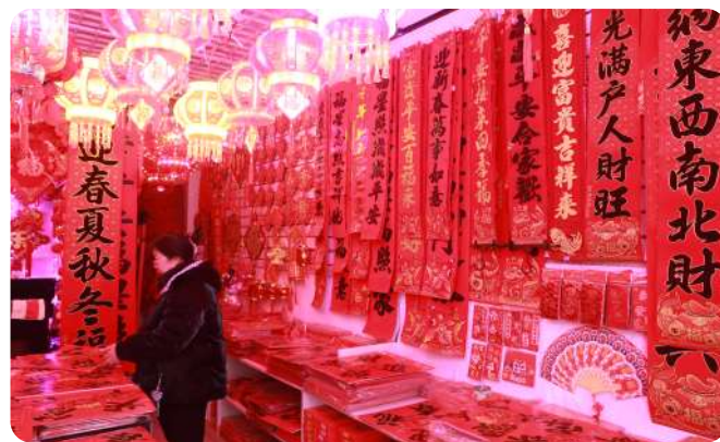
市民选购春联花灯