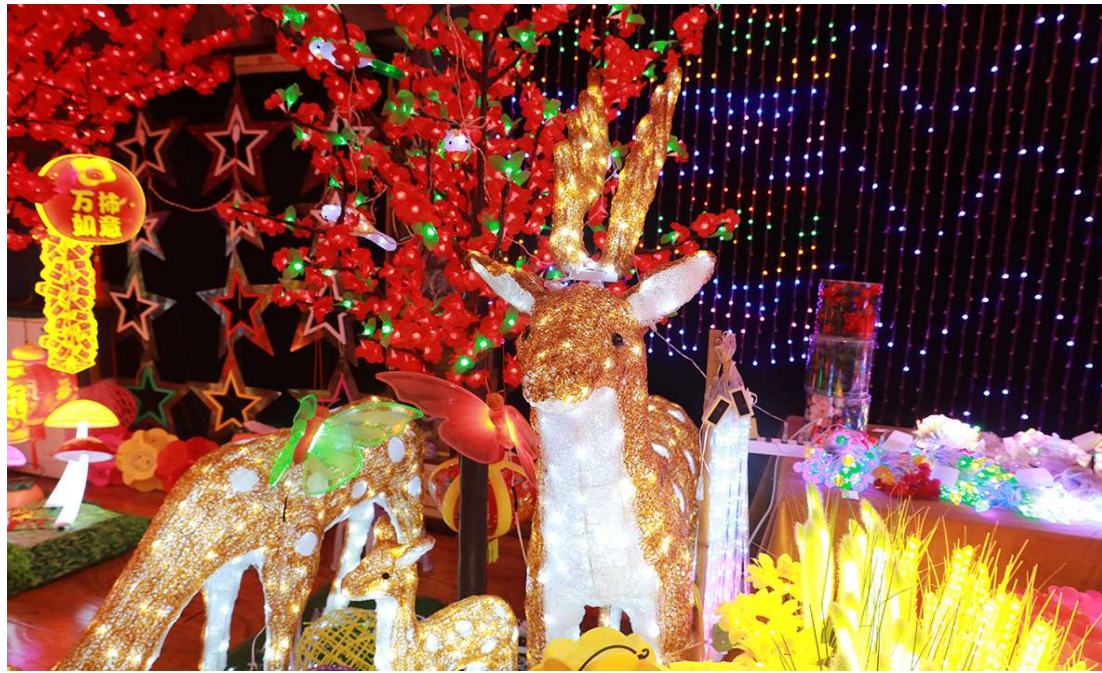
豪德灯笼市场丰富多彩