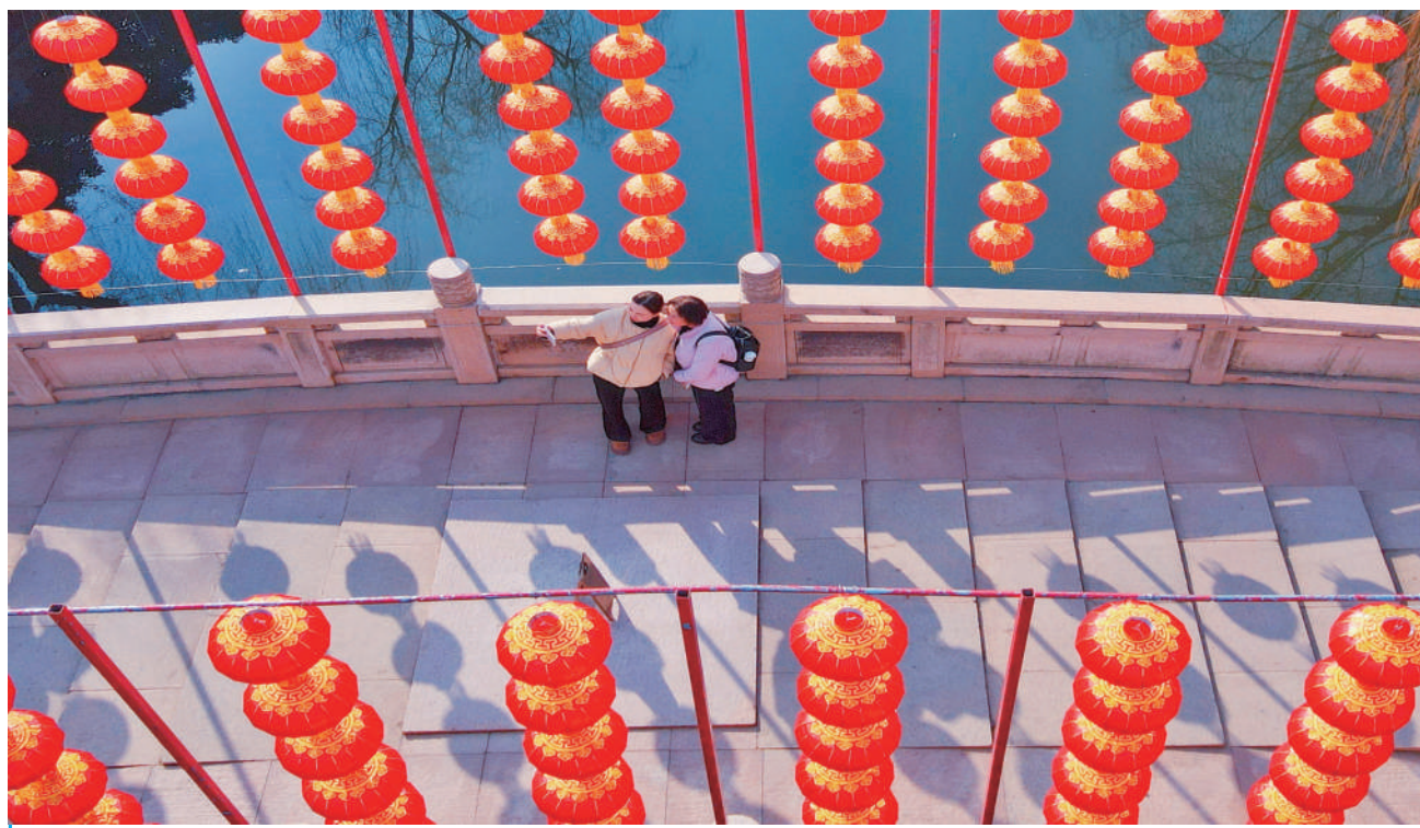
张灯结彩迎新年 1月19日，游客在江苏省如皋水绘园风景区大红灯笼下拍照。春节临近，各地张灯结彩迎新年。