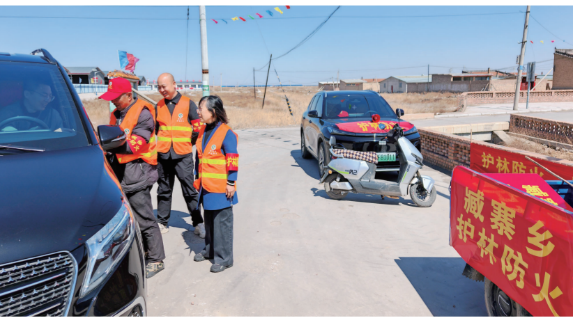
春季气温持续回升，森林防火工作步入关键阶段，应县藏寨乡严格落实乡领导包片、乡干部包村、到村工作大学生驻村、村“两委”干部全天候不间断巡查的联防联控机制...