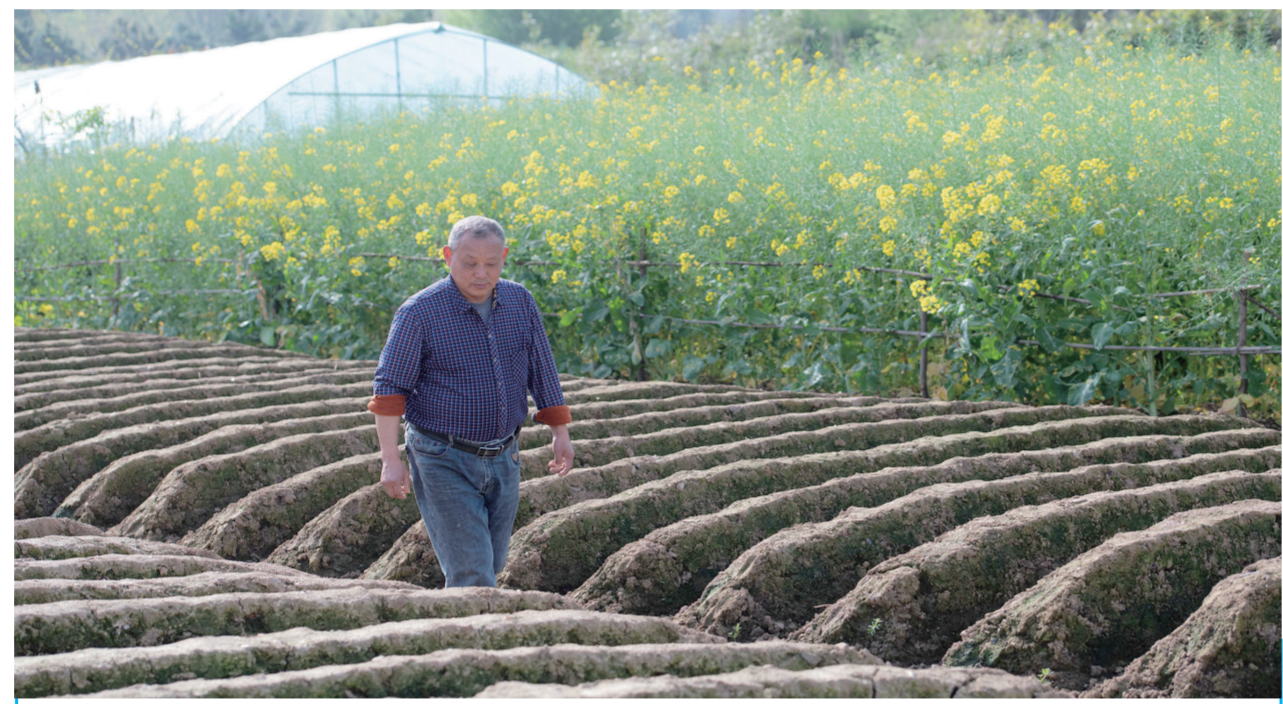
4月5日，在安徽省铜陵市郊区大通镇大院村，农民在姜田里巡视。眼下，在安徽省铜陵市大通镇、天门镇等地，姜农们忙着起垄、种植白姜、施肥、搭建姜棚，田间地头呈现一派忙碌的春耕图景。

据介绍，铜陵白姜已有2000多年种植历史，姜圃保种催芽、高畦高垄种植、芭茅搭棚遮阴等技艺传承至今。2023年，铜陵白姜种植系统被联合国粮农组织认定为全球重要农业文化遗产。每年清明前后是铜陵白姜种植的最佳时节，人们躬身田间，把希望的良种播进沃土，用勤劳的双手延续古老的农耕文明。