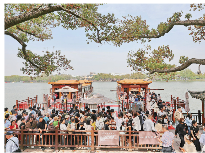
4月5日，游客在浙江省嘉兴市南湖景区湖心岛乘坐游船游玩。清明假期，人们度假休闲，踏青游玩，释放“春日经济”新活力。

气象专家提醒，在清明节假期的最后一天，湖南、江西、福建等地部分地区的雨势较强，公众出行和旅游时需注意安全，尽量远离山区、河谷、地势低洼等地；内蒙古、华北、东北等地风力较大，公众要警惕大风天气对日常生活、交通出行的不利影响，驾车时警惕横风，注意安全。