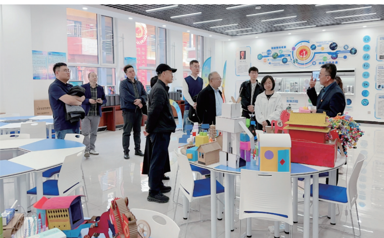
为加快推进教育数字化转型，提升教师人工智能教学应用能力，近日，怀仁市举办以“智启教育新生态·AI赋能新课堂”为主题的中小学人工智能教育赋能提升培训会。