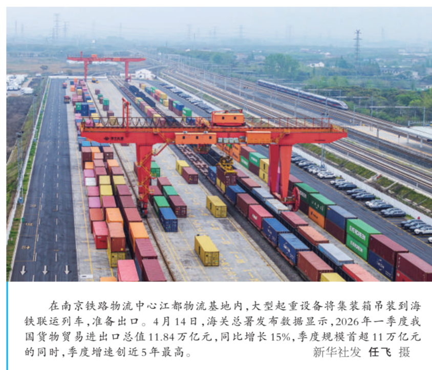
在南京铁路物流中心江都物流基地内,大型起重设备将集装箱吊装到海铁联运列车,准备出口。4月14日,海关总署发布数据显示,2026年一季度我国货物贸易进出口总值11.84万亿元,同比增长15%,季度规模首超11万亿元的同时,季度增速创近5年最高。

新华社北京电(记者 邹雨沁 邹多为)海关总署4月14日发布数据显示,2026年一季度我国货物贸易进出口总值11.84万亿元,同比增长15%,季度规模首超11万亿元的同时,季度增速创近5年最高。 “起势有力、开局良好。”海关总署副署长王军在当天国新办举行的新闻发布会上表示,复杂严峻的外部环境下,一季度我国进出口能够实现较快增长,关键在于我国外贸基础稳、活力足、动能强。 基础稳,主要体现在大盘稳中有进、市场多元稳定。到今年一季度,我国进出口总值已连续12个季度保持在10万亿元以上,增速自2022年四季度以来重回两位数增长。 一季度,我国对东盟、拉美进出口均增长15.4%,对非洲进出口增长23.7%,对欧盟、英国进出口分别增长14.6%、13.1%,有效弥补了对美国进出口下降的缺口。 活力足,主要体现在经营主体活力迸发、区域发展各显所长。一季度,我国有进出口记录的企业达61.8万家,其中民营企业超过54万家,进出口6.78万亿元,同比增长16.2%,占我国进出口总值的比重进一步提升至57.3%;外资企业进出口3.47万亿元,增长16.1%,已连续8个季度实现增长。 同期,我国东部、中西部、东北地区