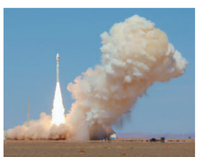
4月14日12时03分,我国在东风商业航天创新试验区使用力箭一号遥十二运载火箭,成功将吉星高分07A02星等8颗卫星发射升空,卫星顺利进入预定轨道,发射任务取得圆满成功。

基点;个人住房新发放贷款(本外币)加权平均利率约为3.1%,比上年同期低约6个基点。 “一季度贷款利率保持在历史低位,助力企业和居民‘轻装上阵’。”西南财经大学中国金融研究院副院长董青马说,近期《个人贷款业务明示综合融资成本规定》对外发布,将推动个贷各项息费“阳光化”“透明化”。规范信贷市场经营行为,有助于降低融资中间费用,促进社会综合融资成本低位运行。 除了信贷,债券融资相关数据也表现突出。一季度,在社会融资规模增量中,企业债券净融资1.05万亿元,同比多5213亿元。 “在社会融资规模增量中,企业债券融资占比升至约7.1%,股票融资占比也有所上升,融资渠道更加多元。”光大证券固定收益首席分析师张旭说,近年来我国金融体系深化转型,企业债券、股权融资等多元渠道不断拓展、相互补充,对银行贷款形成一定替代效应。未来,多元化融资渠道对经营主体的支持作用还将进一步增强。 政策靠前发力、落地见效,高质量发展新动能不断增强。今年继续实施适度宽松的货币政策,增量政策与存量政策有序衔接,政策效果将持续显现,更好助力“十五五”平稳开局。 新华社北京电