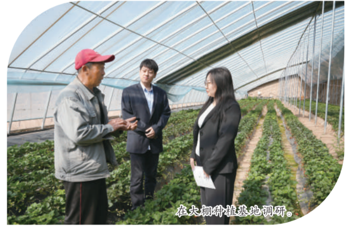
在大棚种植基地调研。