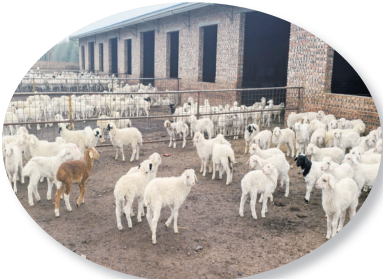
公司为怀仁羔羊肉养殖行业提供融资担保。