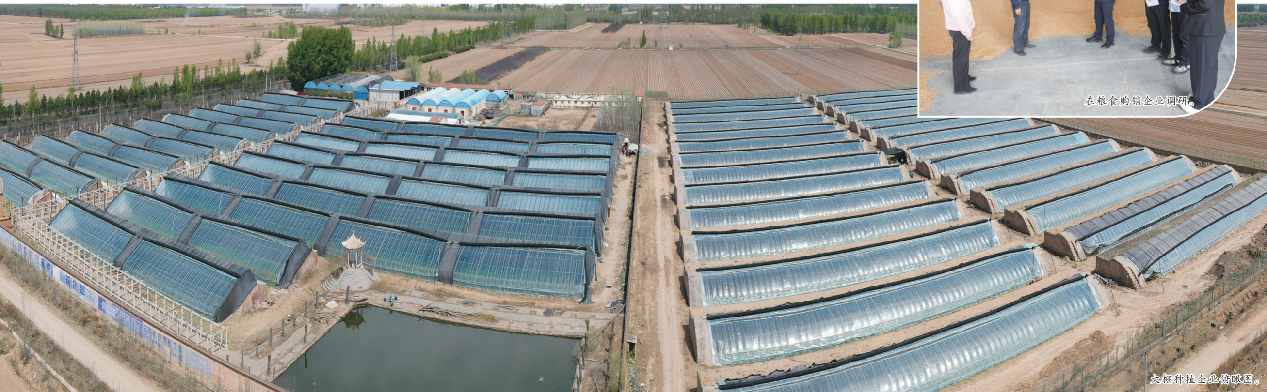
大棚种植企业俯瞰图。