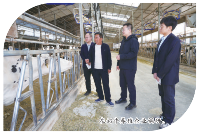
在奶牛养殖企业调研。

站在山西农担成立十周年的新起点,朔州分公司将继续聚焦乡村振兴与地方特色农业产业发展,深化政担协同与银担合作,担当作为、携手前行,为朔州市乡村振兴注入更多金融活水,续写政策性金融助农的崭新篇章。