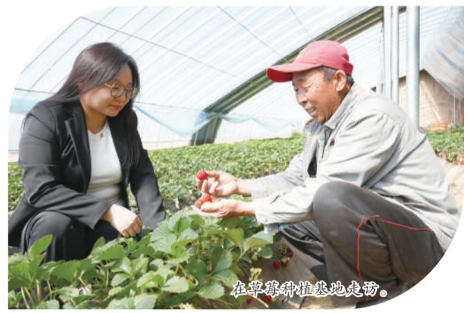
在草莓种植基地走访。