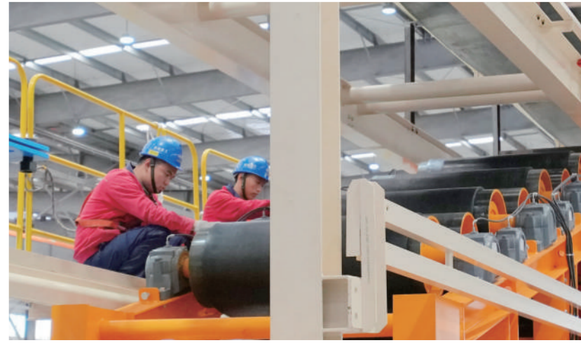
4月21日,由铁建重工自主研发的大型隧道连续皮带机在长沙完成安装调试,即将发运西班牙进行交付。这是国产连续皮带机首次进入西班牙市场。据了解,该套连续皮带机全长4500米,将服务于西班牙巴塞罗那地铁8号线扩建工程。

随着春季园林绿化工作的有序开展,不仅提升了城市品位、优化了城市形象,更切实增强了市民的获得感和幸福感。接下来,该中心将持续深化春季绿化成果,做好“增绿、护绿、活绿、用绿”文章,让城市更加富有生机活力。朔州经济开发区园区事务服务中心副主任宋鹏飞表示,下一步将对全区树木、绿篱开展病虫害防治工作,同时对重点街道新栽串红、万寿菊等时令花卉,预计栽植2000多平方米。在今后的工作中,持续强化精细化管理,做实做细园林养护工作,为市民营造一个舒适宜居的生活环境。