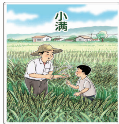
丰收在望 朱慧卿 作