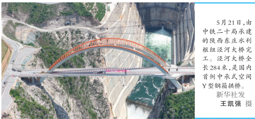
5月21日，由中铁二十局承建的陕西东庄水利枢纽泾河大桥完工。泾河大桥全长284米，是国内首例中承式空间Y型钢箱拱桥。

通知强调，各地要在7月底完成招聘工作，对于三年服务期满、考核合格且愿意留任的特岗教师及时入编并落实工作岗位。要切实落实好特岗教师待遇保障，按照国家有关规定落实好服务期满特岗教师相关优惠政策。