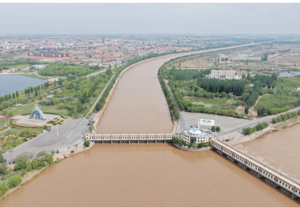
图为5月19日拍摄的三盛公水利枢纽黄河干渠（无人机照片）。

同行”。全国低碳日当天，生态环境部将会同有关部门和单位围绕活动主题，以应对气候变化重点工作为主要内容，开展“线上+线下”宣传活动，深入宣传低碳发展理念，普及应对气候变化知识，提升公众低碳意识，协同推进降碳、减污、扩绿、增长。各有关部门、各地区要围绕活动主题和宣传重点，结合工作实际开展内容丰富的低碳宣传活动，鼓励动员全社会广泛参与，促进绿色低碳发展，推动形成绿色生产生活方式。