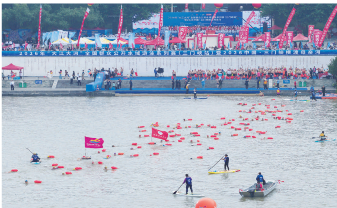
游泳爱好者横渡黄河(无人机照片)。

5月24日,三门峡横渡母亲河活动在河南省三门峡市天鹅湖国家城市湿地公园黄河水域鸣枪开赛,来自全国各地的游泳爱好者逐浪黄河,感受运动的酣畅与快乐。