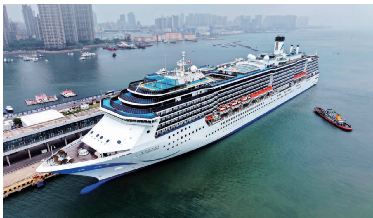
5月25日，“爱达·地中海”号邮轮靠泊青岛邮轮母港码头。随着暑期旅游旺季临近，山东青岛邮轮旅游针对不同年龄和需求的客群，推出12条“邮轮+岸上游”精品线路，覆盖城市风光、人文古迹、特色休闲等多个主题，让更多游客感受“海上度假+城市体验”的独特魅力。据青岛海关统计，2025年青岛国际邮轮母港累计进出境邮轮旅客达7.3万人次，同比增长46.2%。邮轮经济正成为青岛建设现代海洋城市的新引擎。

当前，我国正值汛期，防汛救灾形势复杂严峻。财政部称，将切实绷紧防汛救灾这根弦，始终把保障人民群众生命财产安全放在第一位，紧盯灾情发展变化，强化资金保障，支持地方做好防汛救灾工作。