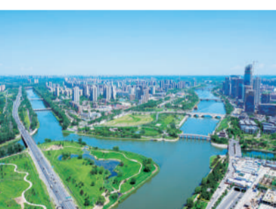
5月29日拍摄的北运河两岸的北京城市副中心。2016年到2026年,北京城市副中心规划建设十周年。十年蝶变,一座宜居宜业、生机勃勃的现代化新城正拔节生长,着眼千年的“未来之城”初具模样。

中医药在护佑儿童青少年健康成长方面底蕴深厚,我国一直重视发挥中医药对于儿童青少年健康的促进作用。据介绍,国家中医药局会同国家卫生健康委等部门共同开展儿童青少年“五健”促进行动,加强儿童青少年肥胖、近视、心理行为异常、脊柱弯曲异常和龋齿等的防治;我国将0至36个月儿童中医药健康管理纳入家庭医生签约服务包,2025年累计服务2420万人次。