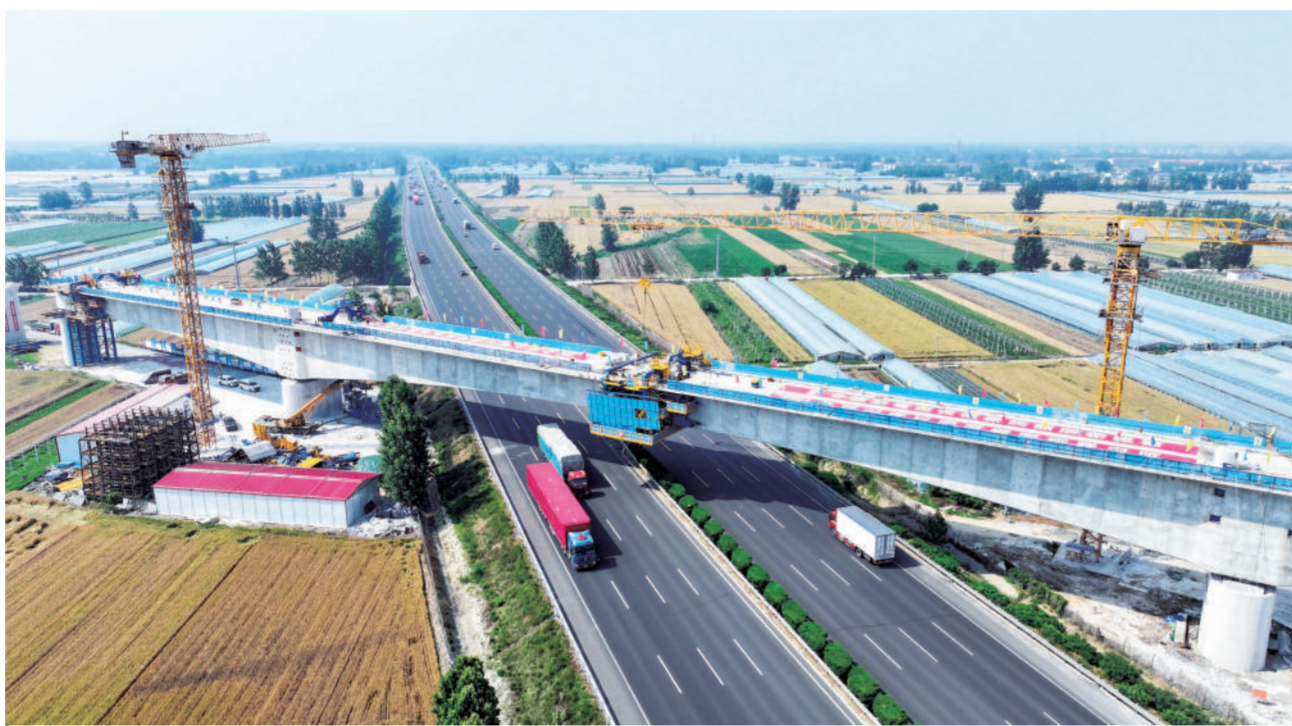
这是拍摄的潍宿高铁山东省临沂市郯城县段跨京沪高速连续梁合龙后的画面。5月31日,由中铁上海局承建的潍(坊)宿(迁)高铁山东省临沂市郯城县段跨京沪高速连续梁顺利合龙,标志着全线重难点控制性工程取得突破性进展,为后续架梁、铺轨作业奠定坚实基础。

据介绍,各级法院、教育、共青团、妇联等部门将用好指南,坚持教育、引导、保护相结合,把对未成年人思想道德与行为规范教育引导融入日常,全方位护航未成年人身心健康,助力未成年人成长成才,培养德智体美劳全面发展的社会主义建设者和接班人。