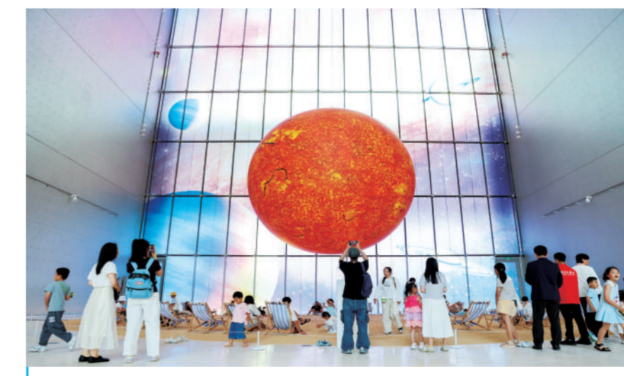
观众在深圳国际美术馆内参观。5月30日,深圳国际美术馆正式面向公众开放。开馆首展推出六大主题艺术展览及一个国宝级文物展。深圳国际美术馆位于深圳市光明区,是集学术研究、展览策划、公共教育、艺术收藏与国际交流于一体的综合性艺术展示交流平台。

6月21日,夏至。入夜之后,北斗七星高挂北方天空,斗柄大致指向正南,轮廓清晰醒目。我国自古便有“斗柄南指,天下皆夏”的民谚,这是古人抬头观天总结出的自然规律,也得到现代天文学的印证。