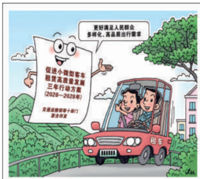
迎来发展新指南 新华社发 徐骏 作

小微型客车租赁是公众出行的重要方式，是激发消费潜能、培育壮大服务消费的重点领域。近日，交通运输部等十部门联合印发《促进小微型客车租赁高质量发展三年行动方案（2026—2028年）》，从5个方面部署开展13项工作，更好满足人民群众多样化、高品质出行需求。