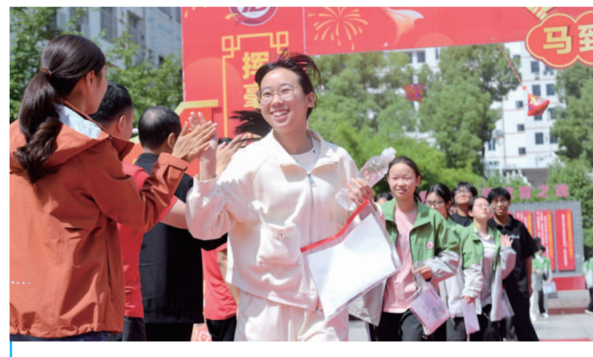
6月9日，在湖北省襄阳市保康县第一中学考点，考生走出考场后与老师击掌。当日，全国部分地区高考结束。新华社发 杨毅 摄

吕大良表示，5月份，我国对非洲建交国全面实施零关税举措，自非洲进口优质特色产品增速进一步加快，像水果、水产品等环比增长均超三成。