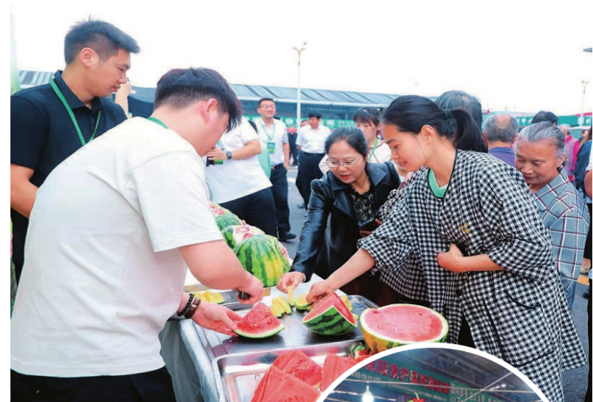
▲2026年夏县夏乐西瓜重庆推介会上，重庆市民争相品尝夏乐西瓜。