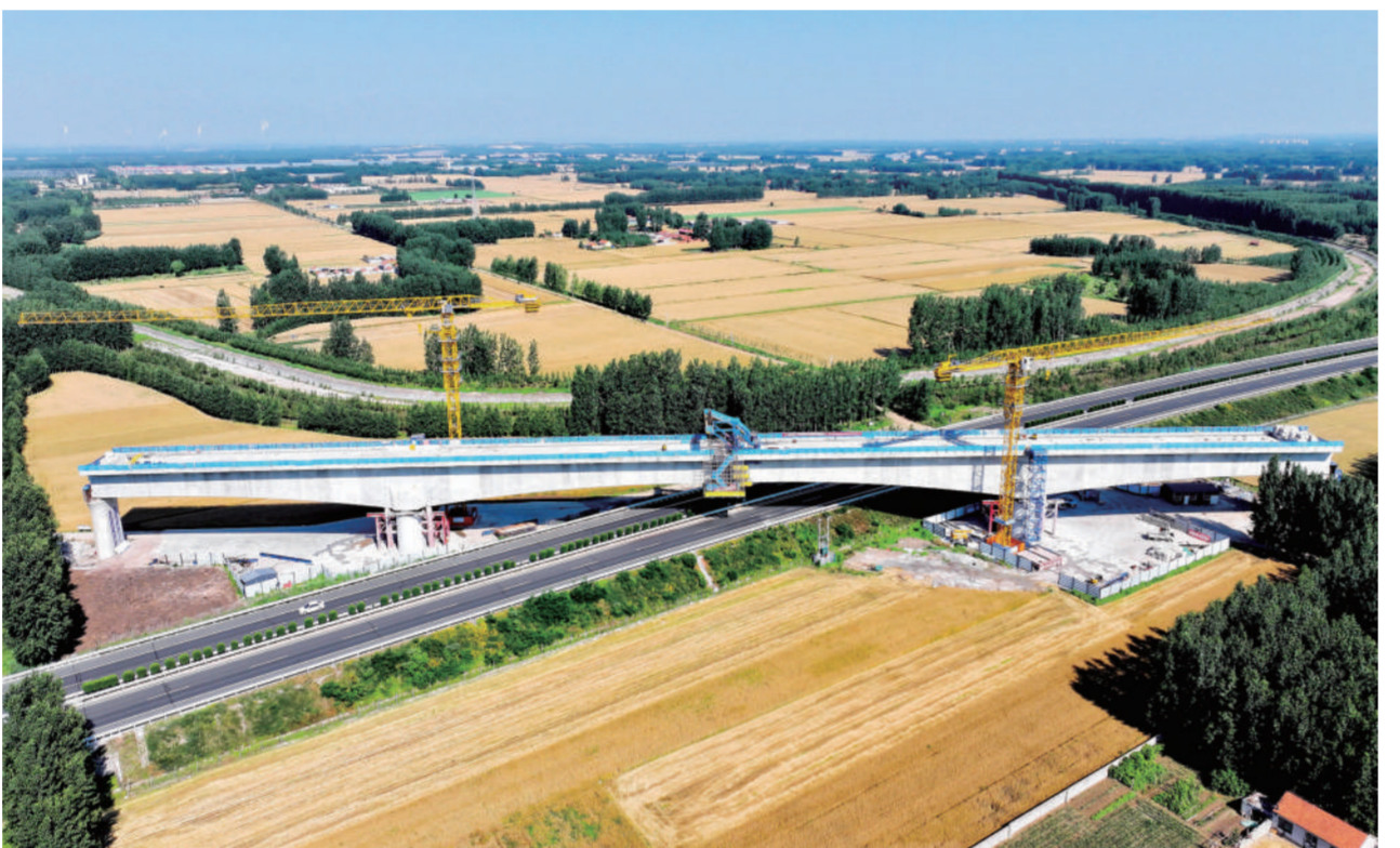
这是6月11日拍摄的雅宿高铁跨日高速连续梁合龙后的画面(无人机照片)。6月11日,由雄安高速铁路有限公司建设、中铁十一局承建的雅(坊)宿(迁)高铁跨日高速连续梁合龙,为后续各项施工奠定基础。