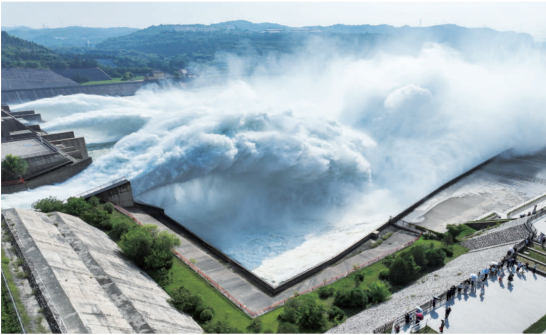
6月27日,游客在黄河小浪底水利枢纽观看“飞瀑”景观。

据了解,下一步,商务部将出台关于加快零售业创新发展的意见,进一步加强行业指导,加大政策支持力度,优化市场环境,总结推广好经验好做法,持续推动零售业创新转型和高质量发展。